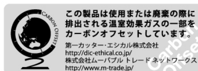
カーボンオフセットシール